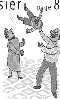
Drôle de pizza, ill. William Steig, Kaléidoscope