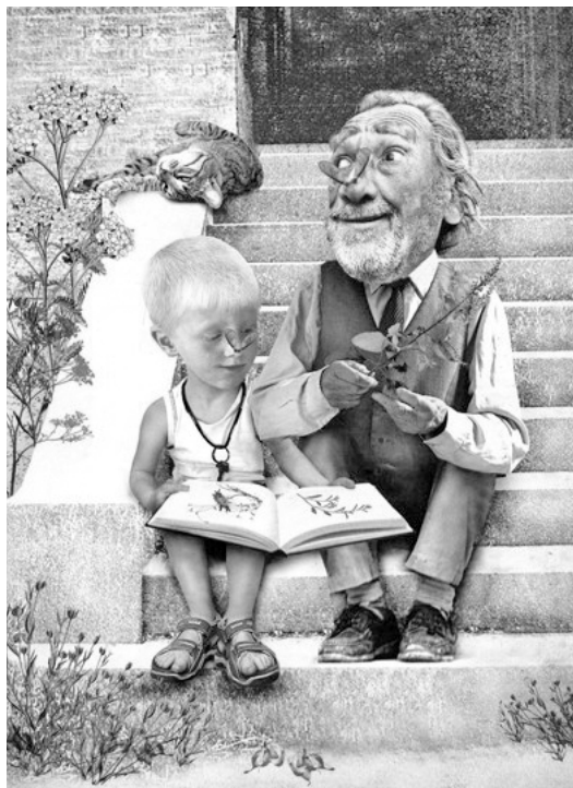
Stian Hole : Garmanns gate , Cappelen (2008) La Rue de Garmann, à paraître chez Albin Michel Jeunesse en novembre prochain

Aux alentours de 1890, l'auteur de Dans le puits et dans l'étang aura enfin des successeurs. Une génération entière d'écrivains qui tranche avec la tradition didactique dominante, selon laquelle le livre pour enfants devait d'abord éduquer à la morale et former l'esprit religieux. La période autour de l'année 1900 est souvent appelée « l'âge d'or » de la littérature classique norvégienne pour la jeunesse : des récits vivants, réalistes, d'une grande qualité littéraire, créés par des écrivains