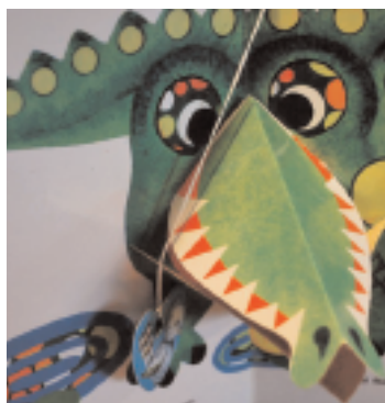
Samuel Marchak : Le Déjeuner du moineau, ill. L. Maïrova, La Farandole, 1978