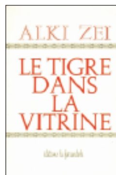
l'un des volumes de la collection Prélude