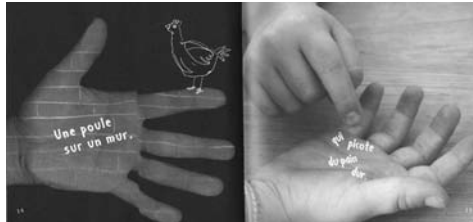
Picoti, picota, ill. A. Louchard, Bayard Jeunesse

I Recension et analyse de plus de 200 nouveautés de l'édition jeunesse, classées par genres : livres d'images, contes, textes illustrés, premières lectures, livres-CD, romans, bandes dessinées, documentaires, multimédia, magazines pour enfants.