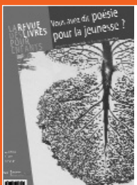
Image de Yan Thomas (détail) extraite de Naturellement. Anthologie de poèmes sur la nature , reproduite avec l'aimable autorisation des éditions Rue du monde