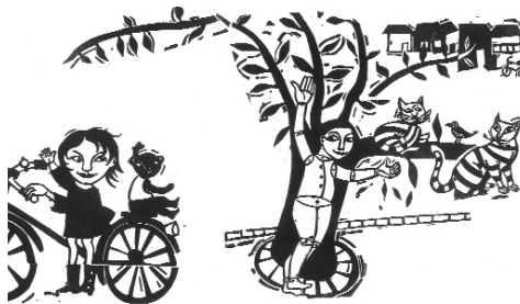
Jean Petit qui danse, ill. C. Mollet, Didier Jeunesse